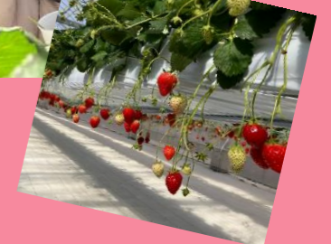
ひな祭りにいちご狩り、暖かくなり、外にでる機会が増え春を感じられる行事もたくさん行いました *